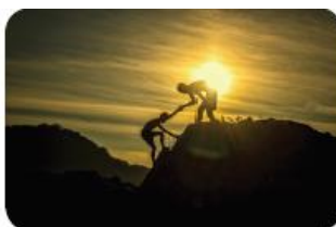
Întărirea capacității de informații în sănătate