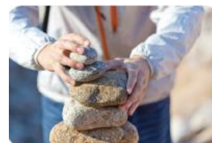
Demonstrarea conceptului de structură sustenabilă