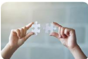
Coordonare, Evaluare și Diseminare