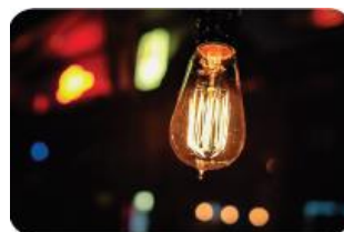
Inovație în informația în sănătate pentru dezvoltarea politicilor de sănătate publică