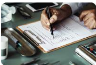
Starea sistemelor de informații în sănătate în UE