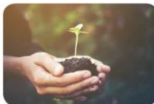
Integrare în politicile naționale și sustenabilitate