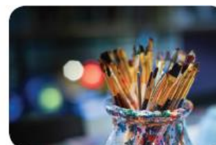
Instrumente și metode pentru sprijinul informației în sănătate