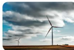
Evaluarea și pilotarea interoperabilității pentru politica de sănătate publică