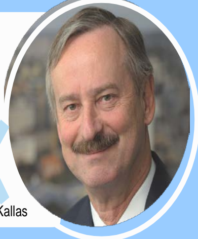
Comisar pentru transport, Siim Kallas

În timp ce răspundem provocării de a face orașele noastre mai curate și mai sigure, trebuie să găsim echilibrul corect pentru nevoile noastre zilnice de transport. Nu ne plac ambuteiajele în trafic, zgomotul și poluarea, și suntem conștienți de riscul accidentelor rutiere. Dar adesea bunele noastre intenții nu se traduc prin mobilitate sustenabilă. De aceea, Săptămâna europeană a mobilității susține dezvoltarea zonelor pietonale și a infrastructurii pentru biciclete, îmbunătățirea transportului în comun și unește comunitățile locale. Atenția de anul acesta asupra Planurilor de mobilitate urbană sustenabilă face apel la orașe să ni se alăture în luarea deciziilor corecte pentru transportul public, folosirea în comun a spațiului rutier și circulației fluide pentru noi toți.