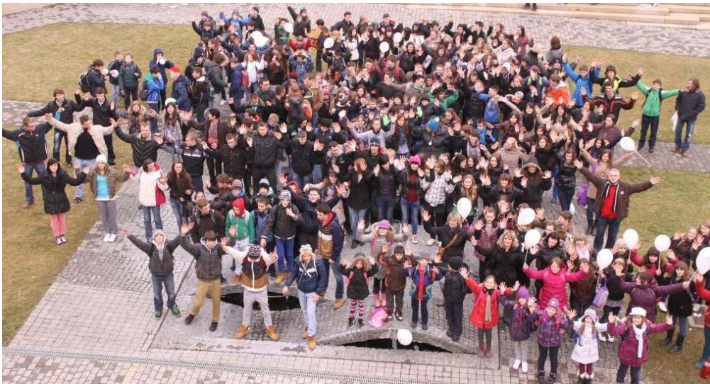
Campania din Croația, 2014

Fotografia va fi făcută într-un loc din țara dumneavoastră care poate fi recunoscut ușor.