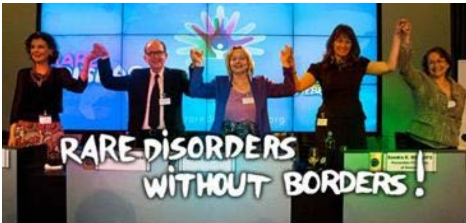
Ziua Bolilor Rare, EURORDIS, 2012, Bruxelles

Îi încurajăm pe toți cei care sunt cu adevărat interesați de bolile rare să se alătore campaniei, respectând spiritul general al Zilei Bolilor Rare