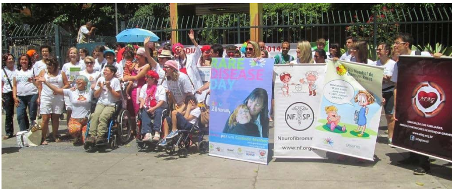
Ziua Bolilor Rare, Brazilia, 2014