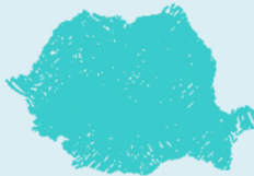
Incidența tuberculozei (cazuri noi) pe județe în anul 2015 -indici la 100 000 de locuitori-

Legenda: 101 - 120 121 - 140 141 - 160 161 - 180 181 - 200 201 - 220 221 - 240 241 - 260 261 - 280 281 - 300 301 - 320 321 - 340 341 - 360 361 - 380 381 - 400 401 - 420 421 - 440 441 - 460 461 - 480 481 - 500 501 - 520 521 - 540 541 - 560 561 - 580 581 - 600 601 - 620 621 - 640 641 - 660 661 - 680 681 - 700 701 - 720 721 - 740 741 - 760 761 - 780 781 - 800 801 - 820 821 - 840 841 - 860 861 - 880 881 - 900 901 - 920 921 - 940 941 - 960 961 - 980 981 - 1000